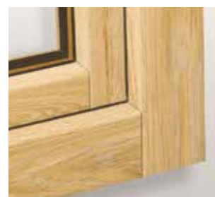
Assemblage extérieur imitation «TENON-MORTAISE»