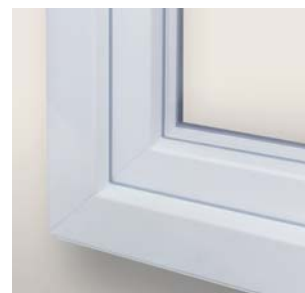
Lignes droites épurées