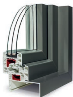
Evolutive® Energy Réno

U_w de 0,8 W/m 2 K avec triple vitrage XN 4/16/4/16/4 XN