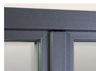
Parclose carrée assortie à la fenêtre