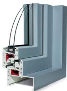
Elegance® Flat Réno